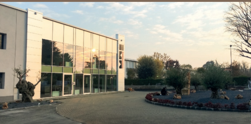
Visuale della nuova sede Ima di Palazzolo Sull'Oglio, triplicata e completamente rinnovata

avanti valori forti, in cui ci siamo sempre riconosciuti e nei quali continuiamo a credere con fermezza.